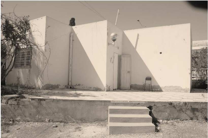
Le centre 4C avant aménagement

Le centre a été aménagé et fonctionnel avec acquisition du matériel bureautique et informatique à la fin de l'année 2020 et il a démarré ses activités au cours de l'année universitaire 2020/2021.