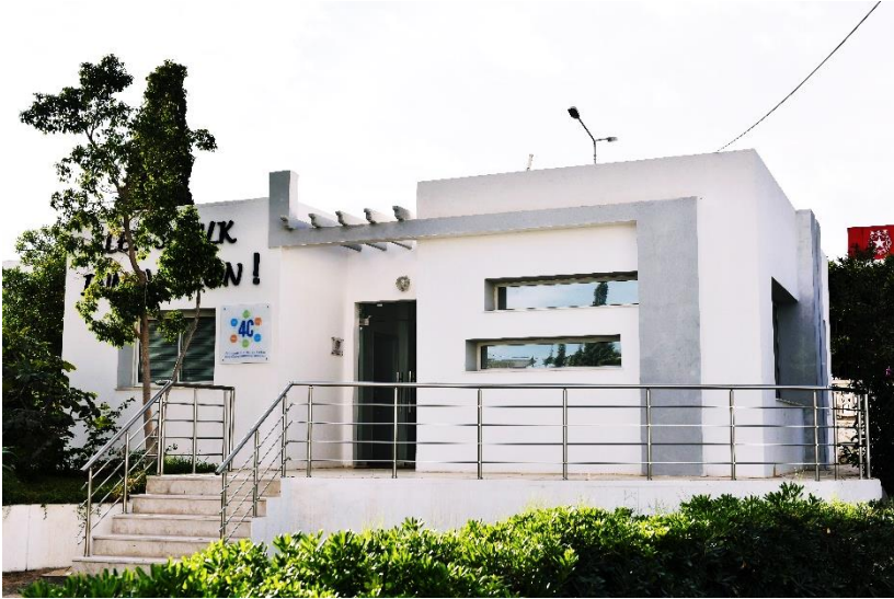
Le centre 4C après aménagement